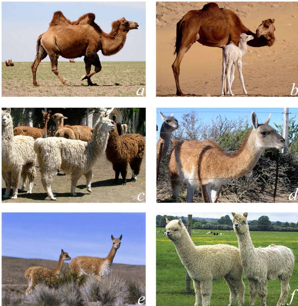
Figura 1: Familia de los camélidos. Los dos paneles superiores muestran a los camélidos del Viejo Mundo (a: camélido bactriano; b: dromedario) y a los camélidos del Nuevo Mundo o Sudamericanos (c: llamas; d: guanacos; e: vicuñas; f: alpacas).

Desde hace miles de años los seres humanos han estado en contacto con los animales y los han domesticado para su provecho, tanto como medio de transporte y carga como por sus pieles, su carne y su leche. El aspecto sanitario es un asunto central que se hizo relevante apenas los animales entraron en contacto con los hombres; tanto unos como otros son susceptibles de contraer enfermedades –letales o no– que pueden transmitirse horizontalmente entre especies. Sin embargo, los descubrimientos científicos sobre las enfermedades infecciosas son relativamente recientes en la historia del conocimiento y las estrategias de control sanitario han sido históricamente enfocadas sobre las formas de ganadería económicamente dominantes como la cría de bovinos, equinos, porcinos, caprinos y ovinos.